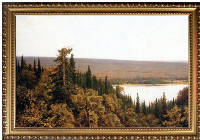
Богатый лог (Пихтовый лес на Каме, 1877)

В Боровецком лесу на территории национального парка «Нижняя Кама» в рамках реализации мероприятий федерального проекта «Сохранение биологического разнообразия и развитие экологического туризма» национального проекта «Экология» создан туристско-рекреационный комплекс «Корабельная роща». На базе туркомплекса возведено новое