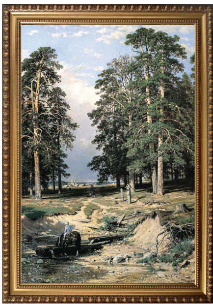
Святой ключ близ Елабуги (1886)

На переднем плане картины «Богатый лог» художник изобразил могучую сосну. На склонах лога мы видим пихтовый лес с острыми вершинами деревьев. Далее простирается Кама, такой она была задолго до создания Нижнекамского водо-