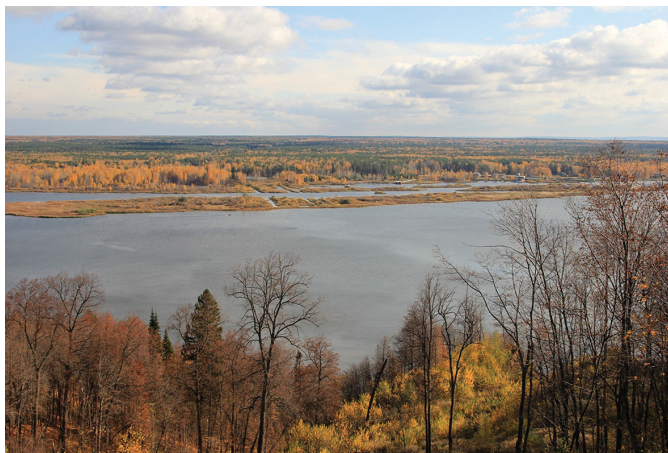
Современный вид с урочища Богатый лог на Каму и Боровецкий лес на противоположном берегу реки

Соседство полумиллионного города отрицательно сказывается на экологическом состоянии Боровецкого леса. Высокая рекреационная нагрузка и вытаптывание по своим отрицательным последствиям ненамного уступают рубкам. Дело осложняется тем, что ещё до организации национального парка в лесном массиве было построено большое количество рекреационных объектов: баз отдыха, лагерей, садоводческих обществ и др. Одно из наиболее популярных мест в Боровецком лесу – родник на его южной опушке, освящённый во имя святой Параскевы Пятницы. Рядом с ним расположен туристско-рекреационный комплекс «Корабельная роща», от которого в лес ведёт одноимённая экологическая тропа.