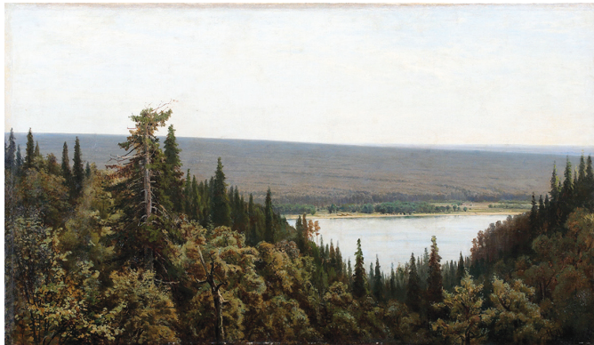
И.И. Шишкин. Богатый лог (Пихтовый лес на Каме, 1877)

сах образуют весенние эфемероиды – хохлатки и ветреницы; при этом наряду с жёлтоцветковой европейской ветреницей лютиковой здесь можно наблюдать белоцветковую ветреницу алтайскую – выходца из Сибири.