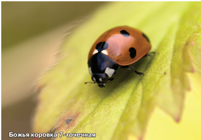
Божья коровка 7-точечная

тела, наколотые на энтомологические булавки, нередко составляют гордость коллекционеров-любителей.